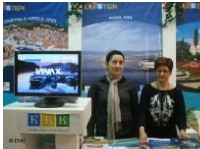
S berlinskog turističkog sajma u ožujku 2011.